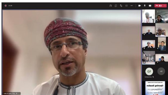
オーフィ長官（オマーン、エネルギー・鉱物省）