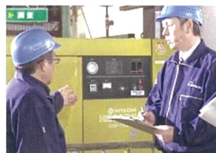
現地診断により問題点の抽出