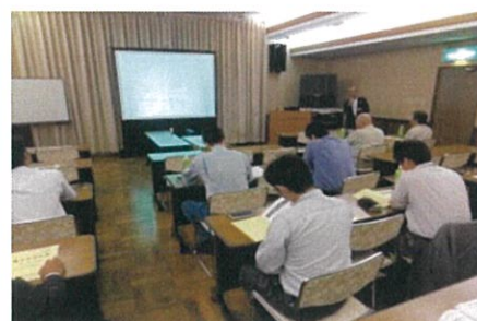
省エネセミナーの実施例

事業者向けの内容と一般家庭向けの内容があり、各1～2時間程度で時間調整は可能です。