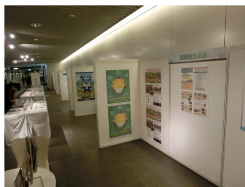
【「広げよう冬の省エネ」ポスター】