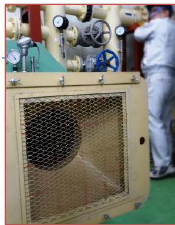
▲ファンの省エネ実習用装置