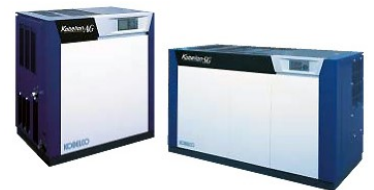
<空気圧縮機イメージ画像>

また、 JFEアドバンテック(株)殿 により、省エネ管理の上でも重要な設備の安定稼働に資する 回転機械設備の設備診断による省エネ について解説します。